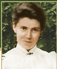
Amy Carmichael (1867-1951)

Der beeindruckende Lebenslauf einer außergewöhnlichen irischen Indienmissionarin: Sie war in Japan, China, Ceylon und kam schließlich nach Indien. Es klingt nach einem Abenteuer, und tatsächlich ist es auch eine sehr spannende Geschichte, oft mit vielen Ängsten verbunden, dennoch mit einem festen Vertrauen auf Gott.