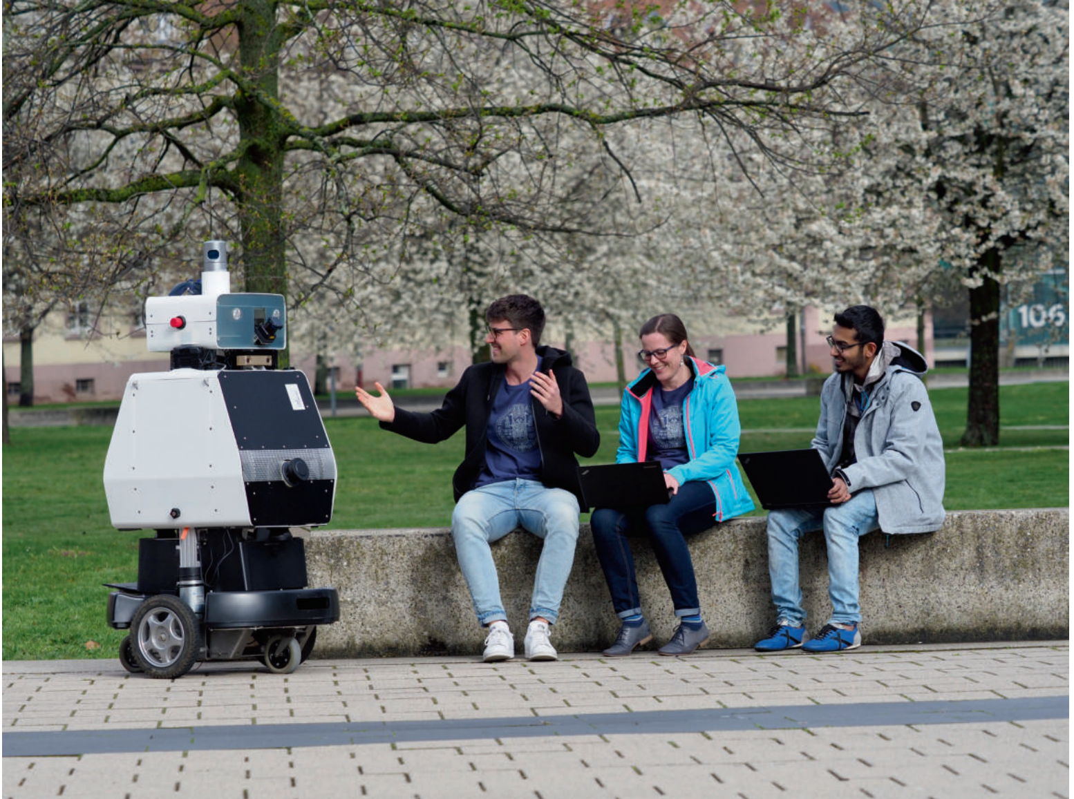
Roboter Obelix findet seinen Weg durch die Technische Fakultät. Er kann Hindernisse erkennen und umgehen und hat bereits autonom den Weg in die Innenstadt gefunden. Die Robotik ist ein Schwerpunkt in der Angewandten Informatik.