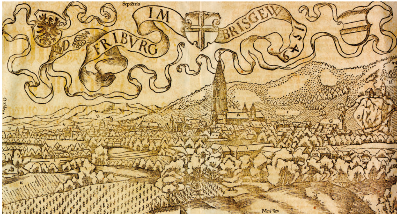
Darstellung der Stadt Freiburg in der »Cosmographia« von Sebastian Münster 1549

aber wie Freiburger Bürger und Steuerzahler behandelt werden sollen. Auch sollen, wie man dann im Jahr 1517 festlegt, nur 26 Akademiker in der Stadt eigenen Grundbesitz erwerben können.