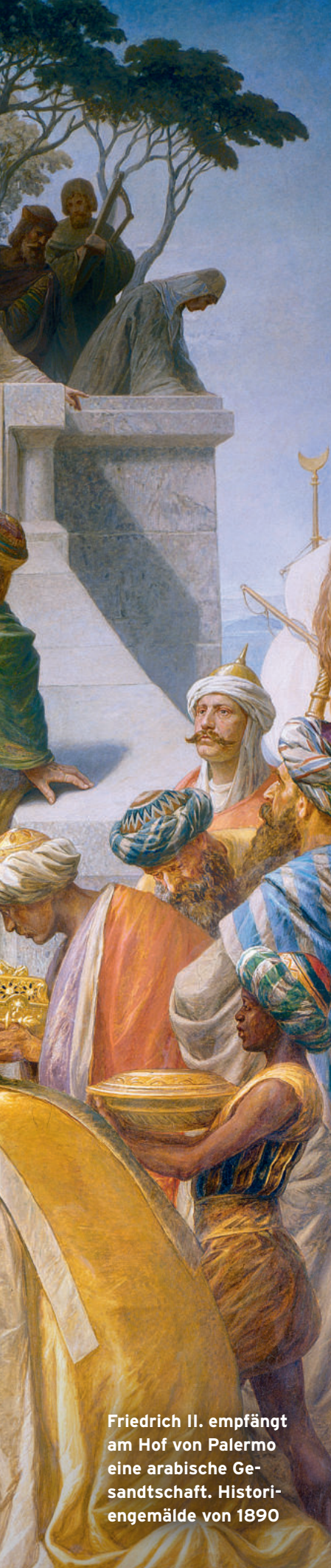
Friedrich II. empfängt am Hof von Palermo eine arabische Gesandtschaft. Historien gemälde von 1890