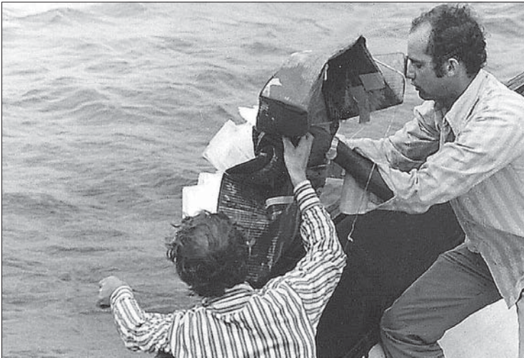
Fidel Castro hatte in Kuba 100.000 Bibeln vernichten lassen. In den frühen 1970er Jahren brachten Verbindungsleute der HMK eingeschweißte Exemplare des Johannes-evangeliums per Flugzeug, Schiff und durch Kuriere übers Meer in Richtung Kuba auf den Weg.