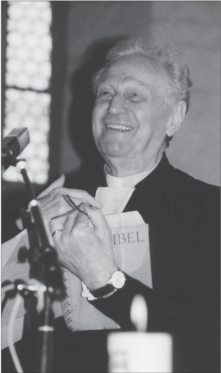
Richard Wurmbrand sprach in großen Hallen und in Kirchen.