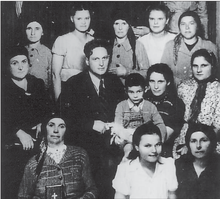
Gläubige der ersten judenchristlichen Gemeinde Wurmbrands.