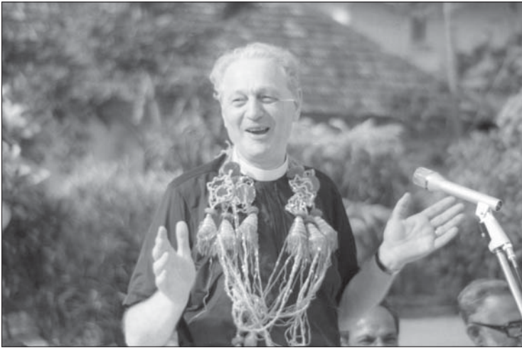
Richard Wurmbrand beim Predigen in Indien.