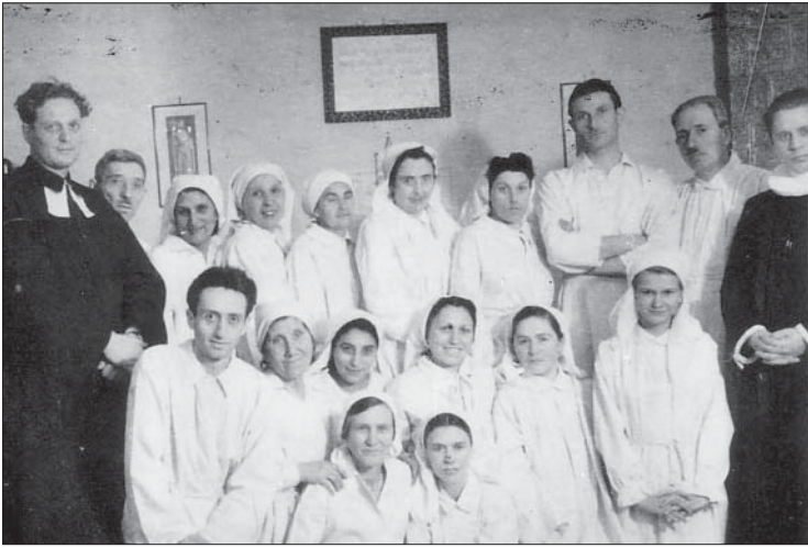
Richard Wurmbrand mit Täuflingen seiner judenchristlichen Gemeinde, Rumänien in den 1940er Jahren.