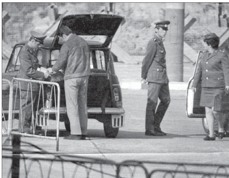
DDR-Grenzbeamte benutzten Bohrer, um bei der Suche nach »illegalen« Bibeln Löcher durch Türen und Wände von Autos zu bohren

Ich hasse das kommunistische System, aber ich liebe die Menschen. Ich hasse die Sünde, aber ich liebe die Sünder. Ich liebe die Kommunisten von ganzem Herzen. Die Kommunisten können Christen zwar töten, aber sie können nicht die Liebe der Christen selbst gegen ihre Peiniger töten. Ich hege nicht die geringste Bitterkeit oder Groll gegen die Kommunisten oder gegen meine Folterer.