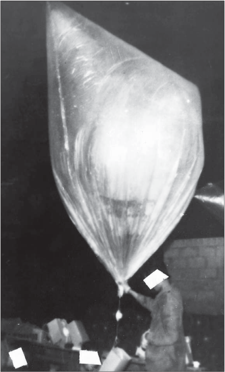
Ballons mit Evangeliumsheften wurden im Jahr 1969 von Südkorea aus nach Nordkorea losgeschickt.