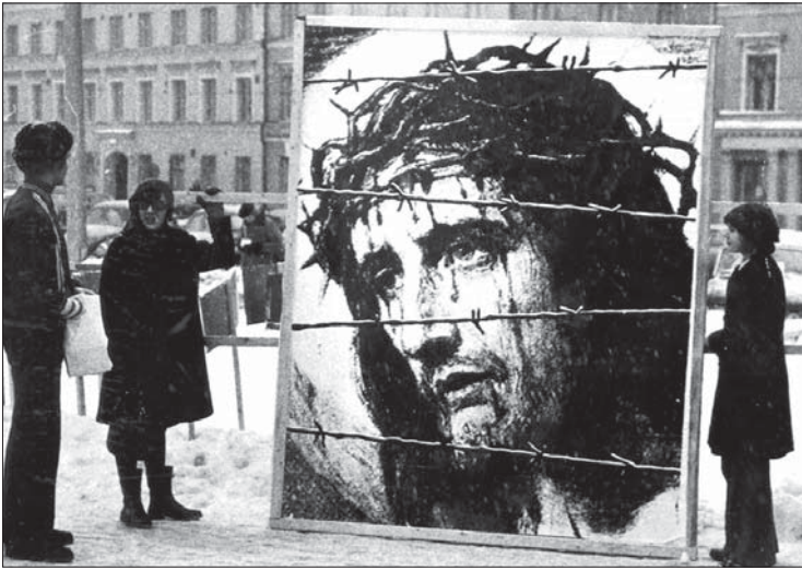
Die »Hilfsaktion Märtyrerkirche« gedenkt in Finnland der christlichen Gefangenen (»Denkt an die Gefangenen, als wärt ihr Mitgefangene.« – Hebräer 13,3).