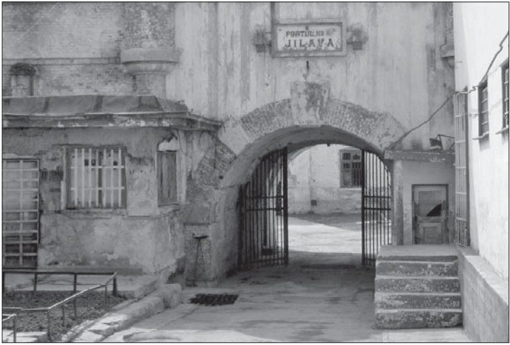
Das hier abgebildete Gefängnis von Jilava ist eines der Gefängnisse, in denen Richard Wurmbrand inhaftiert war. Unten ein Blick in den Zellentrakt.