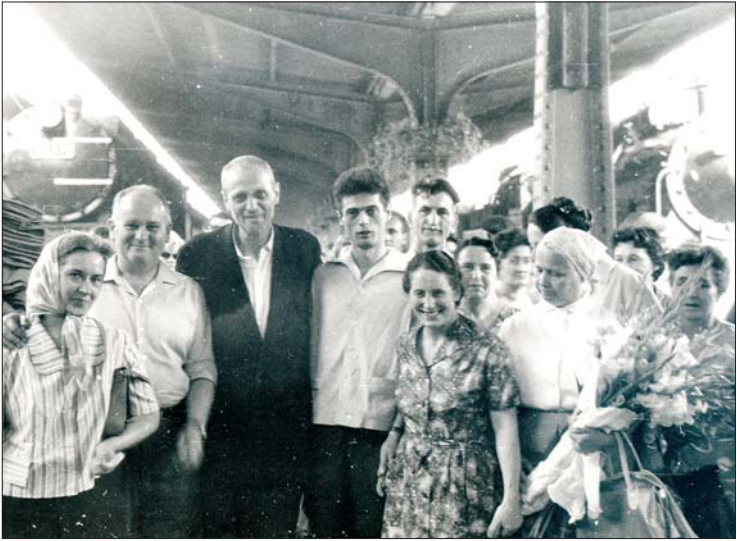
Familie Wurmbrand bei ihrer Ankunft im Westen.