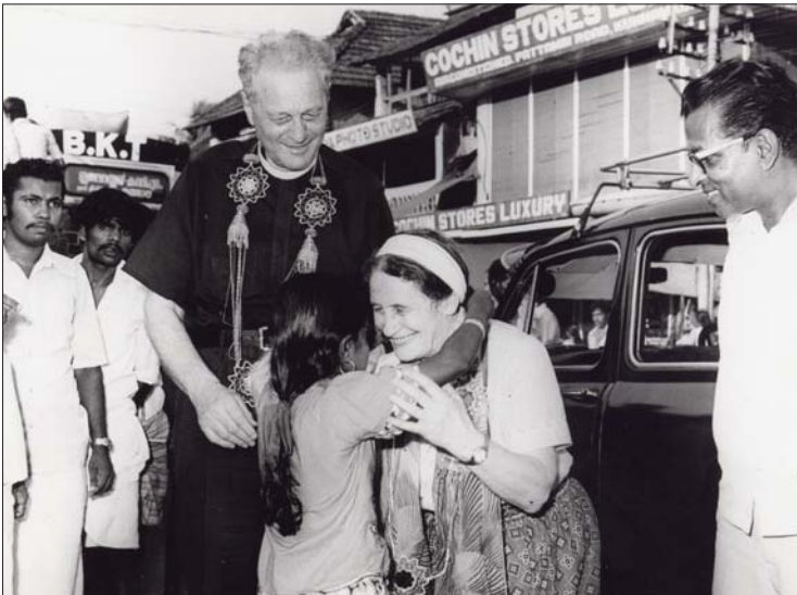
Die Wurmbrands reisten unermüdet um die Welt und verbreiteten die Botschaft der verfolgten Christen. Sabina verstarb im Jahr 2000, Richard ein Jahr später im Jahr 2001. Dieses Foto wurde in Indien aufgenommen.